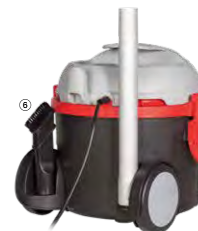
Zwei Zubehörsteckplätze an der Geräte-rückseite für die Fugen-/Polsterdüse oder Aluminiumsaugrohre.