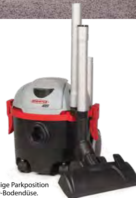
Serienmäßige Parkposition der Energy-Bodendüse. Art.Nr. 111.114

Durch die serienmäßige 2in1 Fugen-/Polsterdüse können selbst schwer erreichbare Stellen und empfindliche Flächen mühelos gereinigt werden. Dank seiner kompakten Abmessungen und seiner umfangreichen Ausstattung ist der SPRINTUS ARES ein vielseitig einsetzbarer Trockensauger, der es selbst mit größeren Reinigungs Herausforderungen spielend aufnimmt.