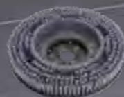
Bürste abrasiv 17" Art.-Nr. 210.227